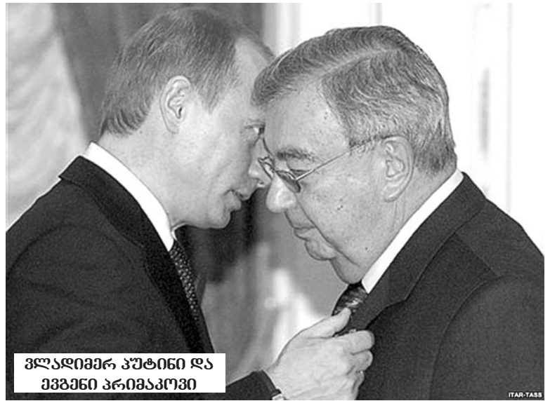
ვლადიმერ პუტინი და ევგენი პრიმაკოვი

ნადგურდეს, მასზე გამარჯვებული ვერ იქნება ვერც მიმა, ვერც გრიშა, ვერც ნიკუტა, ვერც — მელა და ვერც კოლექტიური, უწარსული და უმომავლო ჟორჟოლიანები, ვერც რომელიმე ერი და ვერც ერთი სახელმწიფო. საქართველომ, როგორც სუსტი და უძლურიც არ უნდა იყოს დღეს, თავისი არსებობის მანძილზე უმდიდრესი ღვაწლი დასდო კაცობრიობის ცივილიზაციის ისტორიას და იმიტომ... აქ სააკაშვილები რა მოსატანია?! ახლანან გაერცვლდა ინფორმაცია, აფხაზეთში ფართომასშტაბიანი პრივატიზაცია იგეგმებაო. საქართველო ნატოსკენ მიიწევს, სამხედრო-პოლიტიკური გაერთიანებისკენ, რომელიც სახელმწიფოს აღიარებს იმ საზღვრებში, რომელშიც ნატოში გაერთიანების მომენტი სთვის არის. სეპარატისტულ ე.წ. სამხრეთ ოსეთს კი, რომელსაც, სხვათა შორის, გამსახურდიას პერიოდში გაუქმებული ავტონომია მიხეილ სააკაშვილმა აღუდგინა, საბოლოოდ, საერთაშორისო ლეგიტიმაციისთვის, ტალიავინის კომისიის დასკვნით, ავანტურისტული ომიც კი დაუწყო. აზერბაიჯანი გარეჯის მხრიდან საქართველოს უბედურ ტერიტორი-