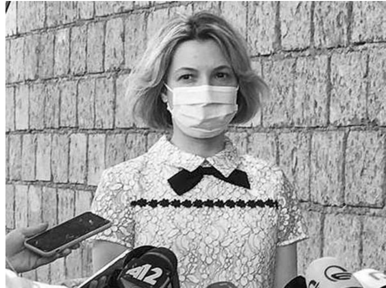
კი გვარიანად აქვს დაჭაობებული.

ესე იგი, ტიპს ისეთი რაღაცები ჩაუწერეს, წესით ცოცხალი აღარ უნდა იყოს. ამას დაუმატეს, მაღალი სტრესული გარემო“. რას ნიშნავს სტრესული გარემო, პატიმრები რომ აგინებდნენ, მაგას? თვითონ და მისმა დამკვეთებმა, მოხვედრი, ჩიტო“ ძალაღობდა და წამებდა მონათლეს, მაგას? სხვათა შორის, დასკვნაში ისიც წერია, რა გართულებები შეიძლება