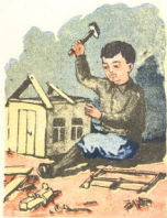
ნახატი გ. ჩიჩინაშვილისა

ციცუნიაც გულგახეთქილი შინისაკენ გარბოდა.