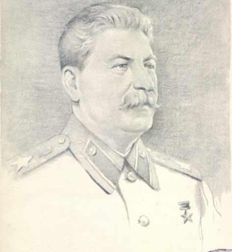
ი. ბ. სტალინი

ნახატი სტალინური პრემიის ლაურეატის, სახალხო მხატვრის უჩა ჯაფარიძისა