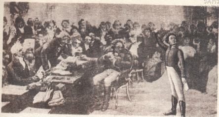
15 წლის პუშკინი კითხულობს თავის ახალ ლექსს: „მოგონებანი ცარსკოე სელოში“

კვსმენია, მაგრამ იგი ამით თავს არ იწონებდა და არ ეოფიანობდა...”