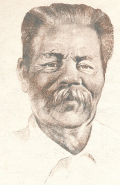
ნახატი უჩა ჯაფარიძისა