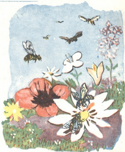
ნახატი პ. დამთბავშილისა