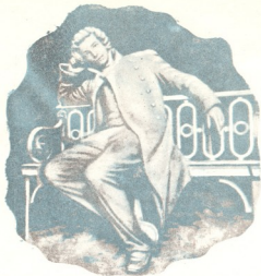
პუშკინი ლიევევის ხალხი