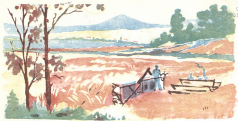
გიორგი შატერაშვილი კაპაზ მარბინი