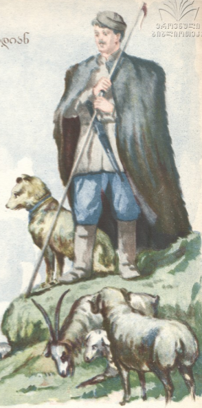
ნახატი გრ. ჩირინაშვილისა

გადაყვითლდა იაღალი, დაღვა ცივი დარები: ჩამოდიან მთიდან ბარში კოდექტივის ფარები. მიდის ცხვარი შირაქისკენ, მწყემსი დაღად ლილინებს. იქ.— შირაქში, ახდაც ისევ მწვანე მოლი ბიბინებს, იქ სითობა და ბაღაბი, მზე იცინის კეთილად: აქ კი მთების იაღალი რთვილით გადაპენტრიდა. მიდის ცხვარი. იმღერიან მწყემსნი,—სოფლის კაცები: ფარებს დინჯათ მიუძღვიან რქამაღალი ვაცები. ჭრიამული აღარ ცხრება ყვეფნ ფარის ძაღლები, გზამშვიდობის, დედაცხვრები!— შირაქს მივახლებით... დაიხამორებთ ბარის გულზე,— ჩვენც სწავლაში ჩავებით, დაგვიბრუნდით გაზაფხულზე მთაში, ქორფა კრავებით.