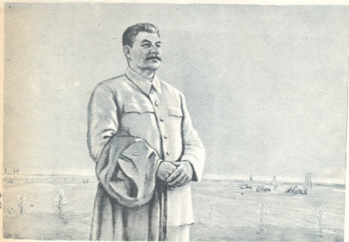
ნახატი სტალინური პრემიის ლაურეატის თ. ს. შურკინისა