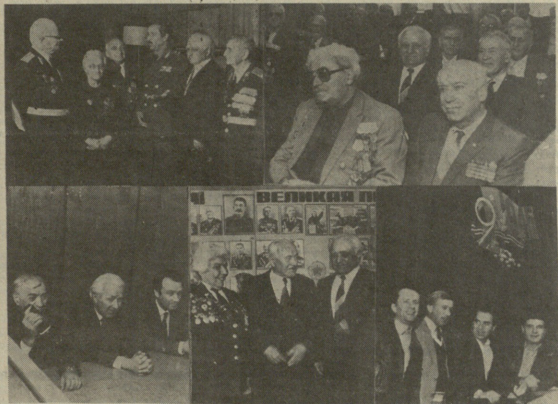
НА СНИМКАХ: во время встречи.

Встреча прошла в теплой, непринужденной обстановке.