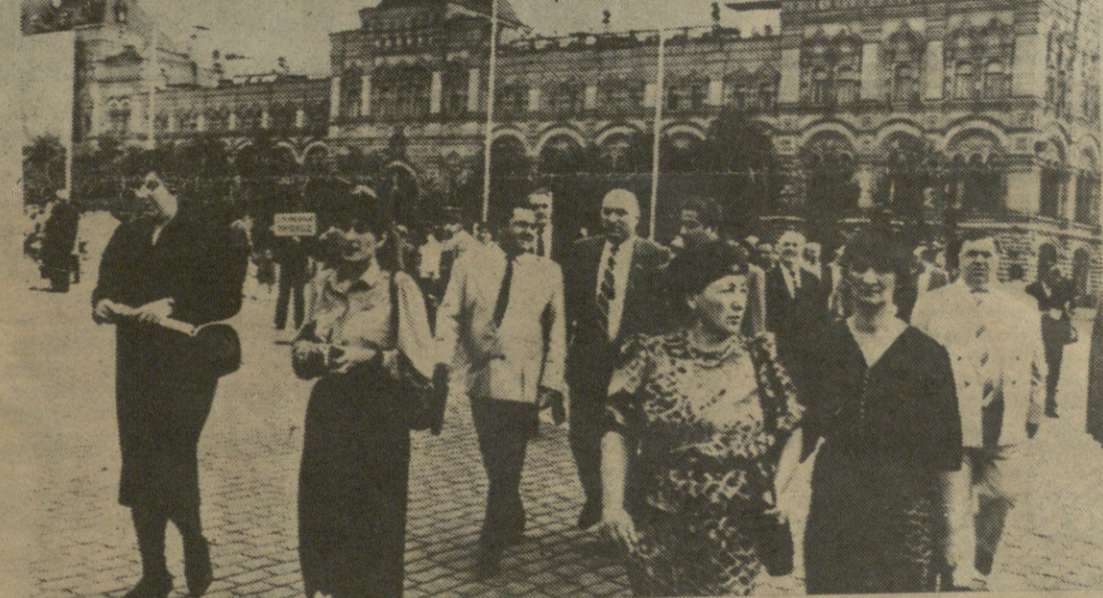
2 ივლისს მოსკოვში, კრემლის ყრილობათა სასახლეში მუშაობა დაიწყო საბჭოთა კავშირის კომუნისტური პარტიის XXVIII ყრილობამ.

პრობებთან უთრირტობის საკითხებზე. დიდი დაფიქრებით, აწონ-დაწონილად განიხილავდნენ თანამედროვე ეტაპზე საბჭოთა კავშირის კომუნისტური პარტიის ეროვნული პოლიტიკის საკითხებს.