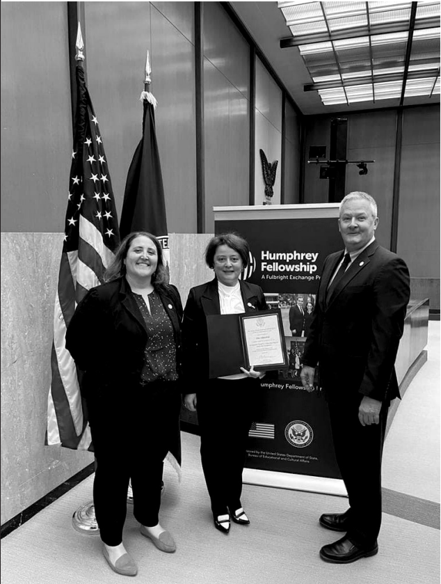
სასწავლო პროგრამის ოფიციალური დასასრულის დონისძიება სახელმწიფო დეპარტამენტში

ეს იყო ამერიკის საელჩოს ჰუმბერტ ჰამფრის პროგრამა, რომელიც ითვალისწინებს იმ პროფესიონალების მიწვევას ამერიკის შეერთებულ შტატებში, რომლებიც არიან პროფესიული კარიერის საშუალო საფეხურზე. მიზნად ისახავს მათ ხელშეწყობას, განვითარებას, რომ უფრო მეტის გაკეთება შეძლონ იმ სამსახურებოსთვის, სადაც ისინი მუშაობენ და ან, ზოგადად, განვითარდნენ პროფესიული კარიერის გზაზე. ჩვენი პროგრამა იყო საჯარო ადმინისტრირების და კონკრეტულად ეხებოდა მედიისა და ინფორმაციის საკითხებს.