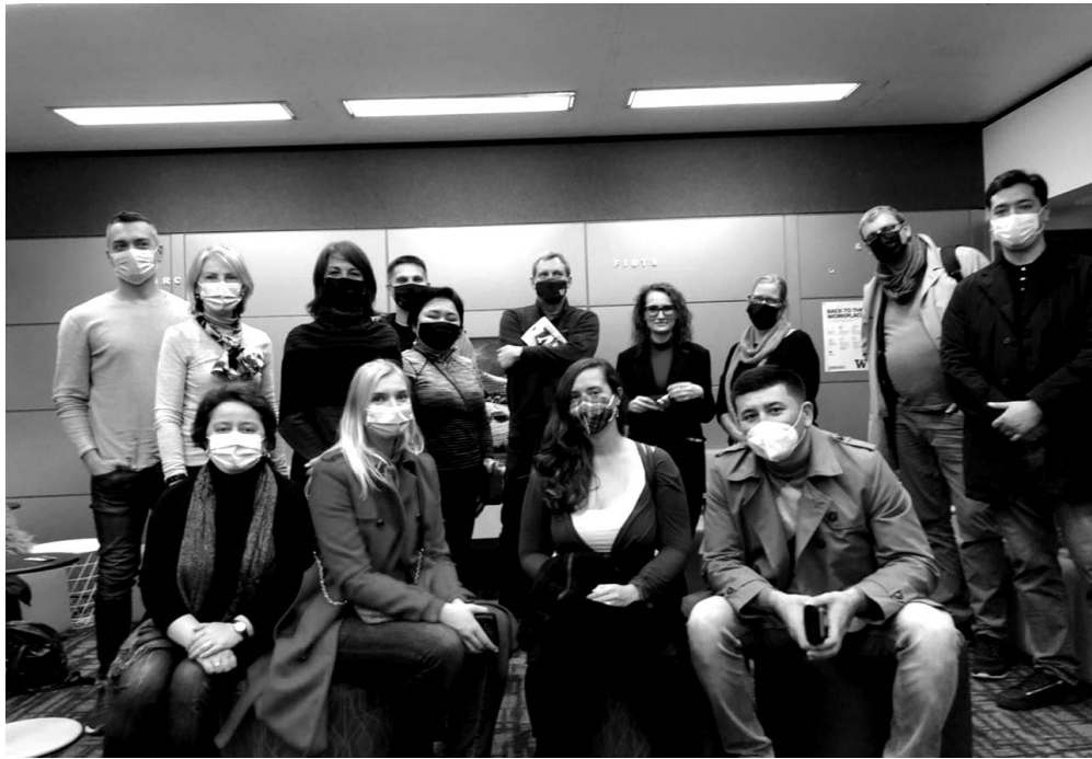
საერთაშორისო სტუდენტური მხარდაჭერის კლუბი. ვაშინგტონის უნივერსიტეტი.

ფედერალურ სამსახურში, რომელიც ყველა შტატს მოიცავს. მართალია შტატებს განსხვავებული კანონმდებლობა აქვთ, მაგრამ ძირითადი მიდგომა არის ერთი და შესაბამისად, ძალიან მნიშვნელოვანი იყო ეს შეხვედრა.