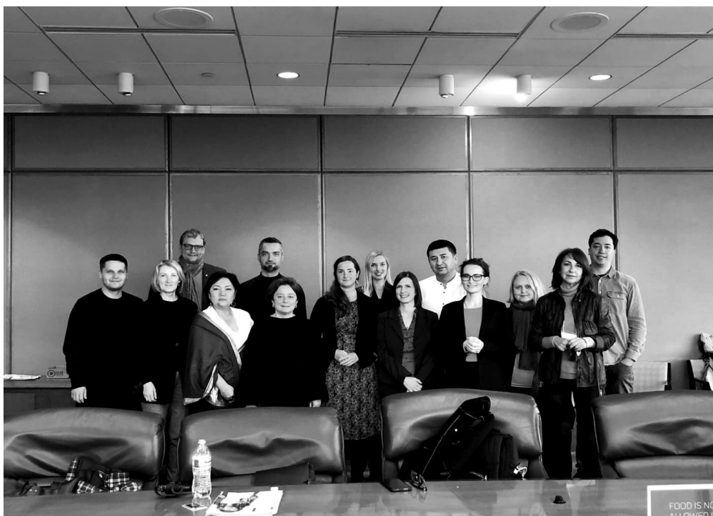
ჰამფრის პროგრამის 2021 წლის გუნდი ვაშინგტონის უნივერსიტეტში.

გარდა ამისა, „მაიკროსოფტის“ გუნდმა ჩაატარა სესიები. ეს იყო სწორედ მედიაწიგნიერებაზე, ეს იყო ეკოლოგიურ ინფორმაციაზე. აქ იგულისხმება არა ინფორმაცია ეკოლოგიის შესახებ, არამედ ინფორმაცია, რომელიც არ არის