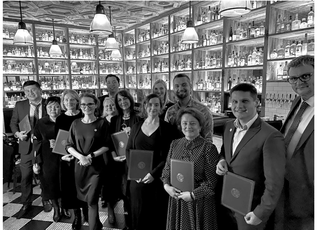
ვაშინგტონის უნივერსიტეტის დიპლომირებული გუნდი

■ პროგრამამ მოგვცა შესაძლებლობა, რომ კულტურული ნაწილიც ჩვენთვის ყოფილიყო ამერიკული გამოცდილების მიღების საშუალება. ჩვენი ინტერესების გათვალისწინებით, მასპინძლების რჩევით დავგეგმეთ რა უნდა გვენახა... რაც ძალიან მომეწონა, არის ის, რომ ვაშინგტონში ყველა ძირითადი მუზეუმი ნებისმიერი დამთვალიერებელისათვის არის უფასო, გეძლევა შესაძლებლობა მსოფლიო კულტურის შედეგები, როგორც არის პიკასო, მოდილიანი, მატისი, ფრიდა კალო