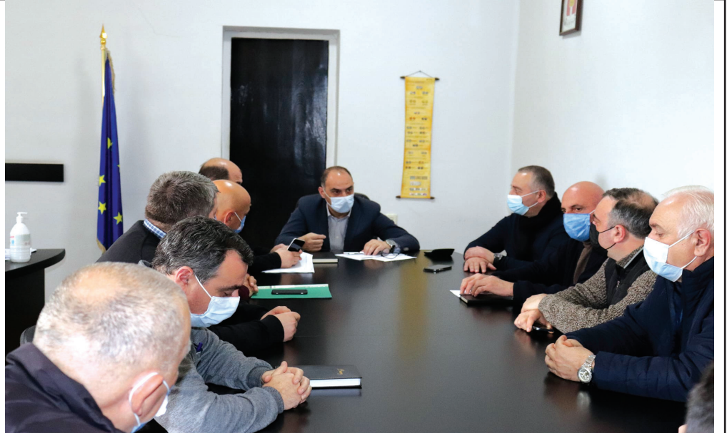
მოადგილეები და სხვადასხვა კომისიის ხელმძღვანელები. ამავე სხდომაზე გაირკვევა თუ რამდენი ფრაქცია იფუნქციონირებს საკრებულოში და ვინ იქნებიან ამ ფრაქციების თავმჯდომარეები და წევრები.

რაც შეეხება ახლადმოწვეული საკრებულოს პირველ სხდომას, იგი ამ კვირაში (სავარაუდოდ 3 დეკემბერს) გაიმართება. მკითხველს შევახსენებთ, რომ სხდომაზე იქნებიან არჩეული საკრებულოს თავმჯდომარე,