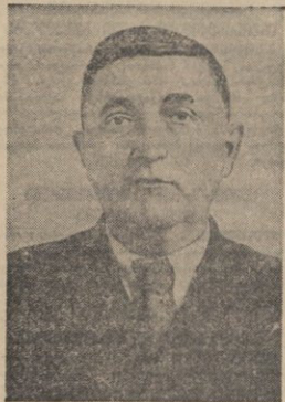
ალექსანდრე თადეოზისძე ხელიძე

ამხ. ალექსანდრე თადეოზისძე ხელიძე საქართველოს სსრ უმაღლესი საბჭოს დეპუტატობის კანდიდატად რეგისტრირებულია ქუთაისის რაიონის ოლქის № 128 საარჩევნო ოლქის საოლქო საარჩევნო კომისიის მიერ. ამხ. ა. თ. ხელიძე დაიბადა ქ. ქუთაისში 1895 წელს. 1927 წლიდან საკავშირო კ. პ. (ბ) წევრია. 1921 წელს დაამთავრა სამხედრო სამედიცინო აკადემია და მიიღო სამხედრო ექიმის წოდება. 20-ზე მეტი წლის მანძილზე მუშაობდა სამხედრო ექიმად ლენინგრადში, თბილისში, ბათუმში და სხვაგან. სამშრომლო ხალხის დიდი სამამულო ომის დღეებში ამხ. ა. ხელიძე, როგორც გამოცდილი სპეციალისტი, სარდლობის პასუხსავე დაევალიდა არსებულ სამხედრო მოსახლეობის მოწესრიგების გაუმჯობესების, დავით აღმაშენებლის ორდენით და სამი მედლით. 1944 წლიდან ამხ. ა. ხელიძე მუშაობს ჯერ საქართველოს სსრ ჯანმრთელობის დაცვის კომისარად, შემდეგ კი მინისტრად.