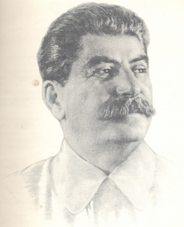
იოსებ ბესარიონის-ძე სტალინი