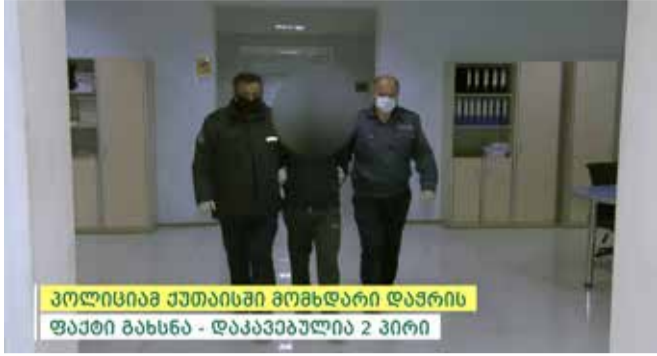
პოლიციაში მუშაის მოხდარი დაჭრის ფაქტი გახსნა - დააკავეს 2 პირი

შინაგან საქმეთა სამინისტროს იმერეთის, რაჭა-ლეჩხუმისა და ქვემო სვანეთის პოლიციის დეპარტამენტის ქუთაისის საქალაქო სამმართველოს თანამშრომლებმა, ჩატარებული ოპერატიულ-სამძებრო და საგამოძიებო მოქმედებების შედეგად, ორი პირი დააკავეს.