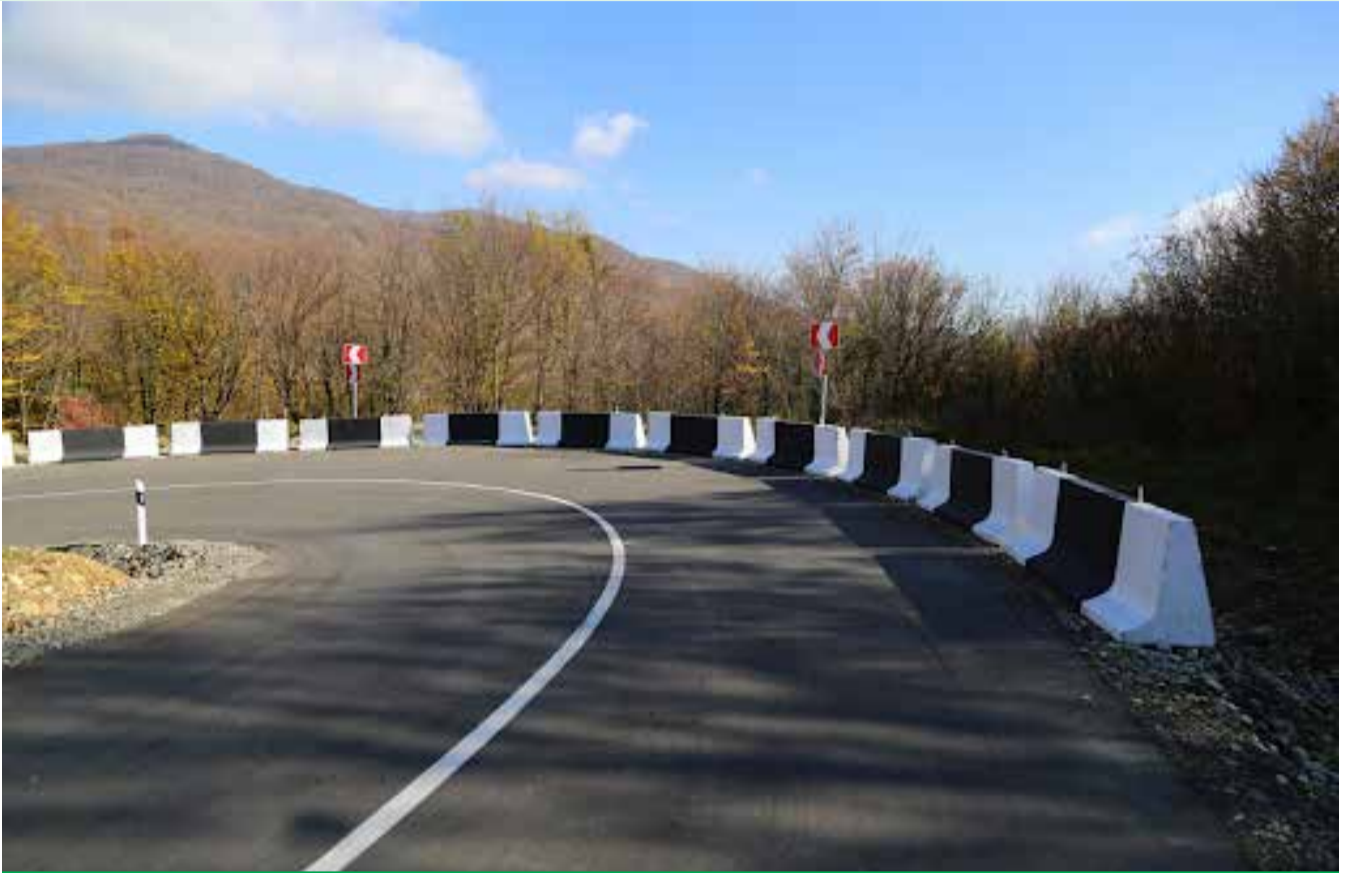
სახელმწიფო აუდიტის დასკვნა მსოფლიო ბანკს წარუდგინება

ამასთან, აუდიტის ჯგუფმა შეისწავლა კლიმატური ცვლილებების მიმართ მდგრადობისკენ მიმართული პრიორიტეტული ღონისძიებების შესყიდვის პროცესი; განსახლების სამოქმედო გეგმის მიხედვით, საკომპენსაციოდ გადახდილი თანხები და გზების უსაფრთხოების ინტეგრაცია აქტივების მართვის პროცესში. აუდიტორებმა განიხილეს განახლებული ხუთწლიანი პროგრამისა და მესამე და მეოთხე წლებისთვის მომ-