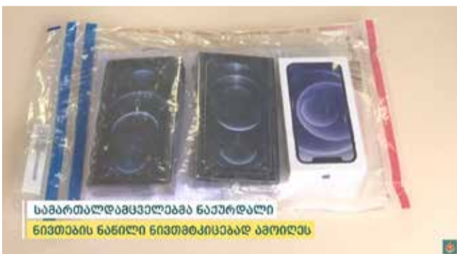
სამართალდამცველებმა ნაპურდული ნივთების ნაწილი ნივთობისაგან აპირდეს

შინაგან საქმეთა სამინისტროს თბილისის პოლიციის დეპარტამენტის ვაკე-საბურთალოს მთავარი სამმართველოს თანამშრომლებმა, ჩატარებული ოპერატიული და საგამოძიებო მოქმედებების შედეგად, 2004 წელს დაბადებული გ. რ., ქურდობის ბრალდებით, შიდა ქართლში დააკავეს.