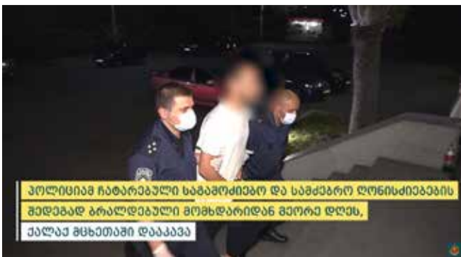
პოლიციამ ჩატარებული საბაზოძიებო და სამებრო ღონისძიებების შედეგად ბრალდებული მომხდარიდან მეორე დღეს, ქალაქ მცხეთაში დააკავა

შინაგან საქმეთა სამინისტროს სამეგრელო-ზემო სვანეთის პოლიციის დეპარტამენტის სენაკის რაიონული სამმართველოს თანამშრომლებმა, ჩატარებული ოპერატიულ-საგამოძიებო და სამებრო ღონისძიებების შედეგად, 1997 წელს დაბადებული ბ. გ., ჯანმრთელობის განზრახ მძიმე დაზიანებისა და ცეცხლსასროლი იარაღის უკანონო შექმნა-შენახვა-ტარების ბრალდებით დააკავეს.