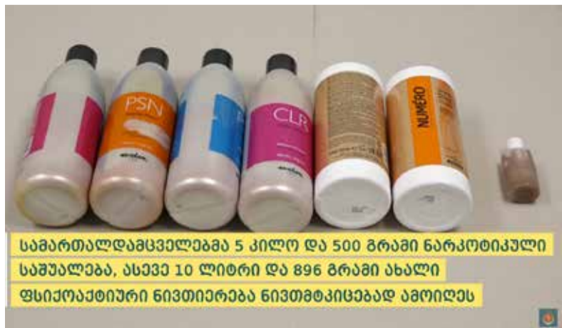
სამართალდამცველებმა 5 კილო და 500 გრამი ნარკოტიკული საშუალება, ასევე 10 ლიტრი და 896 გრამი ახალი ფსიქოაქტიური ნივთიერება ნივთმტკიცებად ამოიღეს

გამოძიება საქართველოს სისხლის სამართლის კოდექსის 260-ე მუხლით მიმდინარეობს.