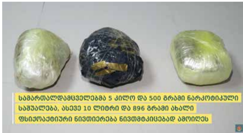
სამართალდამცველებმა 5 კილო და 500 გრამი ნარკოტიკული საშუალება, ასევე 10 ლიტრი და 896 გრამი ახალი ფსიქოაქტიური ნივთიერება ნივთმტკიცებად ამოიღეს