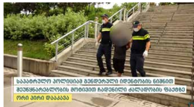
საპატრულო პოლიციამ განდარული იდენტობის ნიშნით შეუწყნარებლობის მოტივით ჩადენილი ძალადობის ფაქტზე ორი პირი დააკავა

გამოძიება საქართველოს სისხლის სამართლის კოდექსის 126-ე მუხლის პირველი პრიმა ნაწილის „ბ“ ქვეპუნქტით მიმდინარეობს, რაც ჯგუფურად ჩადენილ ძალადობას გულისხმობს.