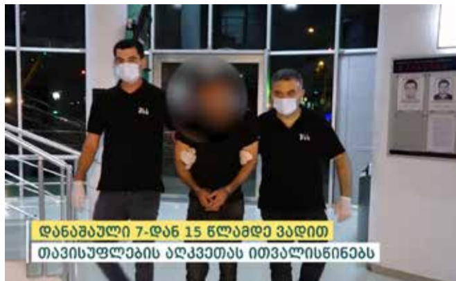
დანაშაული 7-დან 15 წლამდე ვადით თავისუფლების აღკვეთას ითვალისწინებს

შინაგან საქმეთა სამინისტროს თბილისის პოლიციის დეპარტამენტის გლდანი-ნაძალადევის მთავარი სამართალდამცველის თანამშრომლებმა, ცხელ კვალზე ჩატარებული ოპერატიულ-სამძებრო და საგამოძიებო მოქმედებების შედეგად, 1985 წელს დაბადებული, წარსულში ნასამართლევ დ.დ., განზრახ მკვლელობის მცდელობის ბრალდებით დააკავეს. დანაშაული 7-დან 15 წლამდე ვადით თავისუფლების აღკვეთას ითვალისწინებს.