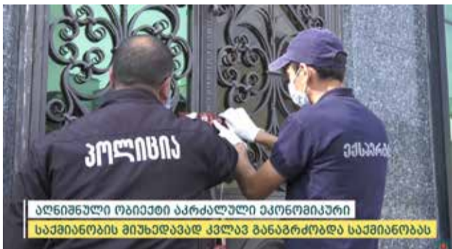
აღნიშნული ობიექტი აკრძალული ეკონომიკური საქმიანობის მიუხედავად კვლავ განაგრძობდა საქმიანობას

შინაგან საქმეთა სამინისტროს სამცხე-ჯავახეთის პოლიციის დეპარტამენტის თანამშრომლებმა, ჩატარებული საგამოძიებო მოქმედებების შედეგად, იზოლაციისა და კარანტინის წესების განმეორებით დარღვევის გამო, ახალქალაქში მდებარე სარიტუალო დარბაზი დალუქეს.