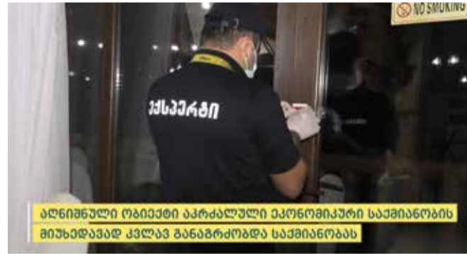
აღნიშნული ობიექტი აკრძალული ეკონომიკური საქმიანობის მიუხედავად კვლავ განაგრძობდა საქმიანობას

შინაგან საქმეთა სამინისტროს აჭარის პოლიციის დეპარტამენტის თანამშრომლებმა, ჩატარებული საგამოძიებო მოქმედებების შედეგად, იზოლაციისა და კარანტინის წესების განმეორებით დარღვევის გამო, ხელვაჩაურის მუნიციპალიტეტში მდებარე რესტორანი „ჩვენებური“ დალუქეს.