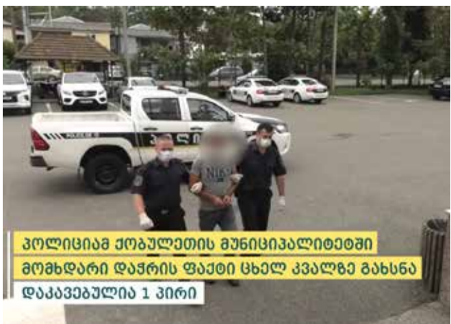
პოლიციამ ქობულეთის მუნიციპალიტეტში მომხდარი დაჭრის ფაქტი ცხელ კვალზე გახსნა დააკავებულია 1 პირი

პოლიციამ ბრალდებული მომხდარიდან რამდენიმე საათში, ცხელ კვალზე, ქობულეთში დააკავა. ჯანმრთელობის განზრახ მძიმე დაზიანების ფაქტზე გამოძიება საქართველოს სისხლის სამართლის კოდექსის 117-ე მუხლის პირველი ნაწილით მიმდინარეობს.