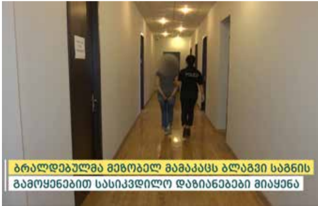
ბრალდებულმა მკვლავლ მამაკაცს ბლავგი საგნის გამოყენებით სასიკვდილო დაზიანება მიაცენა

განზრახ მკვლელობის ფაქტზე გამოძიება საქართველოს სისხლის სამართლის კოდექსის 108-ე მუხლით მიმდინარეობს.