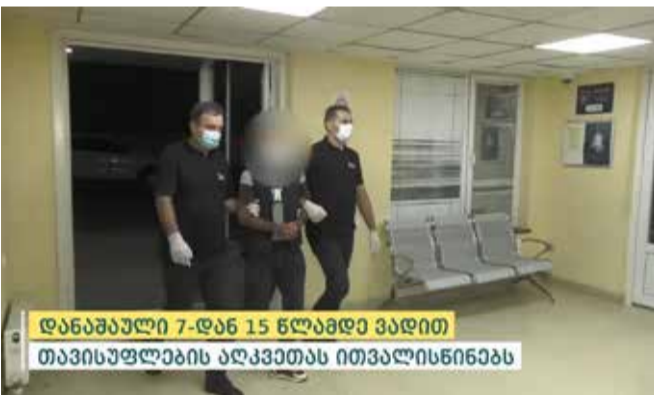
დანაშაული 7-დან 15 წლამდე ვადით თავისუფლების აღკვეთას ითვალისწინებს