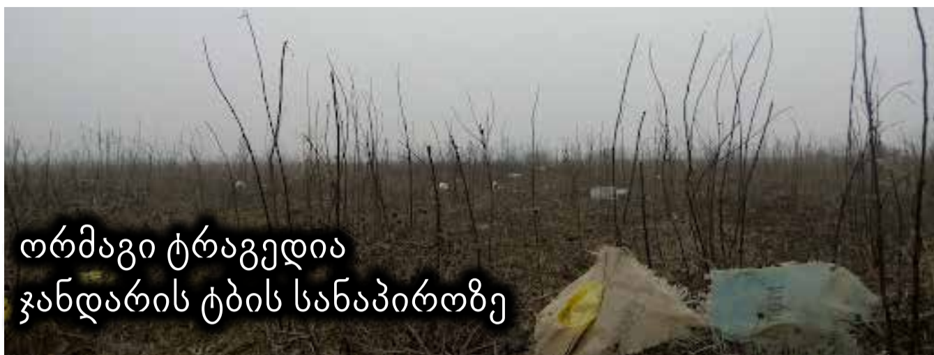
ტრეაგი ტრაგედია ჯანდარის ტბის სანაპიროზე

შურისძიების სურვილი ის გრძნობაა, რომელიც, შესაძლოა, ათეული წლები გაგყვეს და ელოდო მომენტს, როცა შეძლებ, შური იძიო. შურისმაძიებლები ხშირად სასტიკები არიან, იმაზე სასტიკებიც, ვიდრე თავად შეუძლიათ წარმოდგენა და ყველაფერი ეს წლების განმავლობაში დაგროვილი ბრაზის გამო ხდება. არცთუ იშვიათად, საქართველოს მთაში ყოფილა შემთხვევა, როცა შური ათი და ოცი წლის მერეც კი იძიეს – სისხლი აიღეს, თუმცა შემთხვევას, რომელზეც ახლა გიამბობთ, სისხლის აღებასთან კავშირი არ აქვს. არადა, პირველ ეტაპზე, გამოძიების მთავარი ვერსია სწორედ ეს იყო.