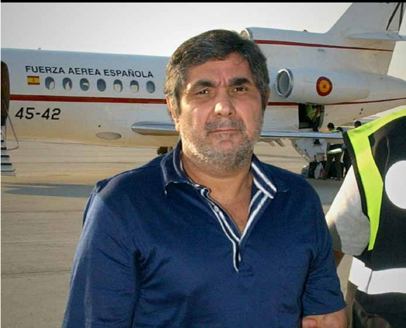
რა ავანტურაზე მიდის კალაშოვის ადვოკატი