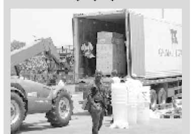
გვინეის დედაქალაქში შიშითა და შიშითა ციფრები, ძვირფასების ხელშეწყობაში შიშითა კარანტინი

ლაბორატორიულმა ტესტებმა დადასტურეს გვინეის დედაქალაქში ებოლას ციფრ-ცნელების არსებობა ოთხ პაციენტში. დაავადებულთა ოჯახები იზოლირებულია. ადგილობრივი ჯანმრთელობის დაცვის სამინისტრო ცდილობს, შეაჩეროს ვირუსის გავრცელება, რისგანაც სულ ცოტა 60 კაცი დაიღუპა.