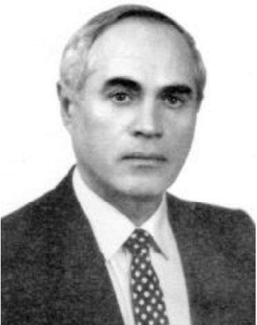
შისრულდა 80 წელი გამორჩეული ქართველი მათემატიკოსისა და საზოგადო მოღვაწის, საქართველოს მეცნიერებათა ეროვნული აკადემიის წამდგომი წევრის, პროფესორ გურამ ხარატიშვილის დაბადებიდან.

ვის თეორიის პრობლემებზე ლექციების წასაკითხად იგი არაერთხელ მიიწვიეს უცხოეთის სამეცნიერო ცენტრებში.