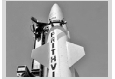
ინდოეთმა მისთვის გაემართა რაკეტა, რომელსაც შეუძლია, გააღობოს ბირთვული ძოვიანი

რაკეტა გაუშვეს ჩანდიპურის პოლიგონიდან ინდოეთის აღმოსავლეთ შტატ ორისაში. მან გადალახა 350 კილომეტრი, რაც მაქსიმალურ განგარიშებულ სიშორეს შეადგენს. „ეს იყო შესანიშნავი გაშვება“, — კომენტარი გაუკეთეს რაკეტის გაშვებას ინდოელმა ჩინოვნიკებმა.