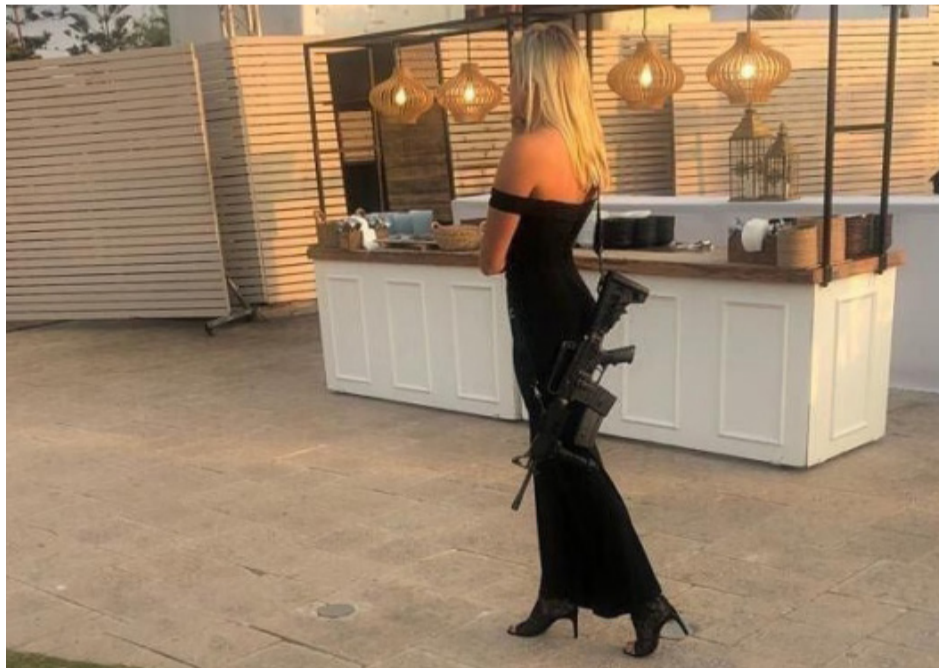
ჯარის ქალი ქორწილში მიდის