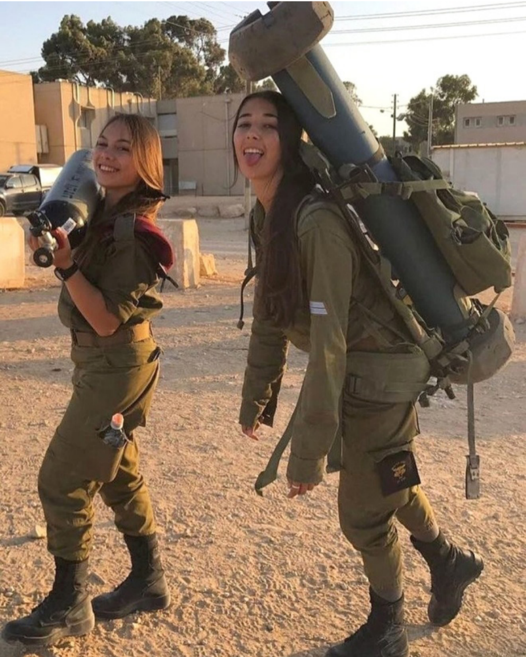
სამშობლოს დამცველებს მძიმე ტვირთიც ემსუბუქებათ