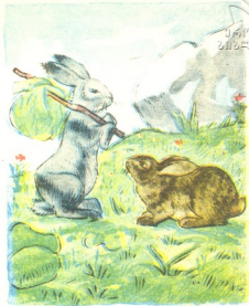
ნახატები ს. შაბაშვილისა

— ცოტა ხანს მოვიციდი, იქნებ გამოჩნდეს! — გაივლო გულში და ბუჩქებში გაინაბა.