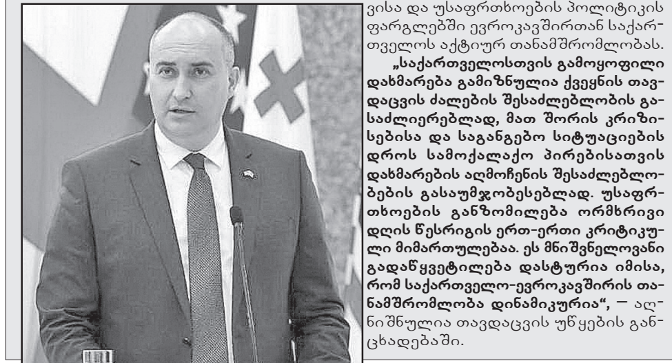
საქართველოსთვის გამოყოფილი დახმარება გამოიზრდება ქვეყნის თავდაცვის ძალების შესაძლებლობის გაძლიერებად, მათ შორის კრიზისებისა და საგანგებო სიტუაციების დროს სამოქალაქო პირებისათვის დახმარების აღმოჩენის შესაძლებლობების გასაუმჯობესებლად. უსაფრთხოების განზომილება ორმხრივი დღის წესრიგის ერთ-ერთი კრიტიკული მიმართულებაა. ეს მნიშვნელოვანი გადაწყვეტილება დასტურია იმისა, რომ საქართველო-ევროკავშირის თანამშრომლობა დინამიკურია“, — აღნიშნულია თავდაცვის უწყების განცხადებაში.

მხარდაჭერის პაკეტი 12.75 მილიონ ევროს შეადგენს და 36 თვეზეა გათვლილი. პაკეტის მიზანი ქვეყნის თავდაცვისუნარიანობის გაძლიერება და იმ შესაძლებლობების განვითარებაა, რომლებიც ხელს შეუწყობს ერთიანი თავდაცვისა და უსაფრთხოების პოლიტიკის ფარგლებში ევროკავშირთან საქართველოს აქტიურ თანამშრომლობას.