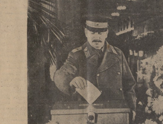
მოსკოვი, 1947 წლის 21 დეკემბერი. მშრომელთა დემონსტრაციის ადგილობრივი საბჭოების არჩევნები...