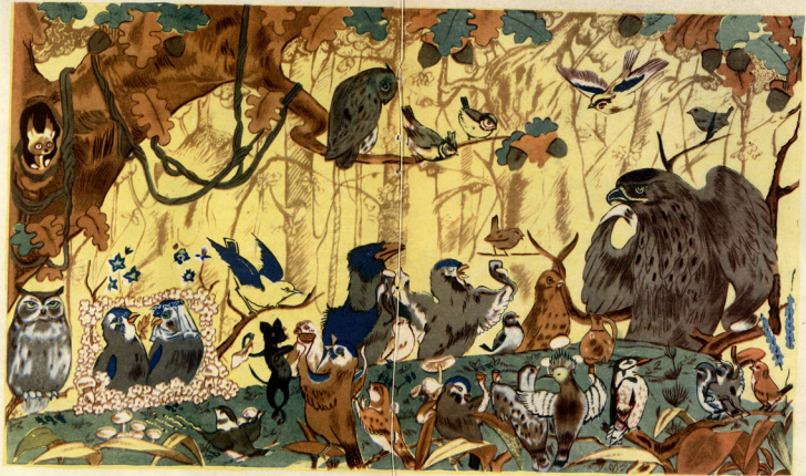
ვაჟა-ფშაველას მითხრობის „ჩხიკვთა ქორწილი“-ს ილუსტრაცია