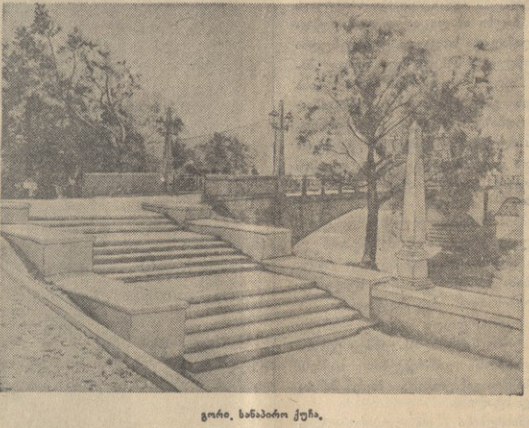
გორი, ხანაბი ქუჩა.