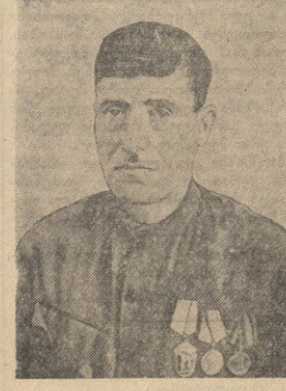
გ. ა. გვინია ცხაკიას რაიონის თვალბის სასოფლო სა- ბჭოს ხეივანის სახელობის კოლმეურნეობის მებრძოლესი, სოციალისტური შრომის გ- მირის წოდება მიეცა 3 ჰექტარი ფართობის თეთივლი ჰექტარზე 107,80 ცენტრები სი- მინის მიღებისათვის.