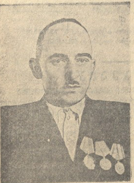
ა. ვ. ავსტინა გალის რაიონის ხალხების კოლმე- ურნეობის ბრევიდარი, სოციალისტური შრომის გმირის წოდება მიეცა 8 ჰექტარი ფართობის თეთივლი ჰექტარზე 87,90 ცენ- ტრები სიმინის მიღებისათვის.