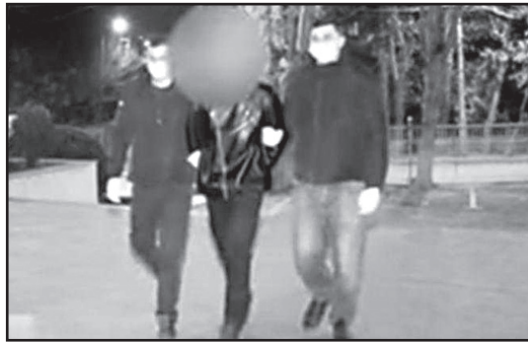
პოლიციამ 2 პირი დააკავა