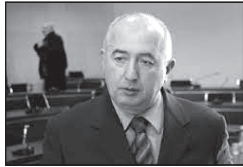
ნამდვილად, გარანტირებულად არაფერი არ შეიცვლება და 2024 წლიდან შეიძლება შეიცვალოს და შეიძლება ყველაფერი ძველებურად დარჩეს.

პაატა ზაქარეიშვილი: „ორი ძალა დაეტაკა ერთმანეთს, „ქართული ოცნება“, რომელიც ხალხს არ ახარებს და ნაციონალური მოძრაობა, რომელიც ხალხს ამნარებს“