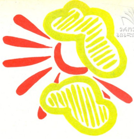
თარგმანი შ. ქარჩავასი

ამბობენ, გუგულად იქცა საბრალო ქალი და მას მერე, გაზაფხულზე, სწორედ იმ დროს, როცა ძმები დაეღუპნენ, გუ- გუს ძახილით მათ დასტირისო!