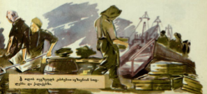
ქ აფის აფის მჩველი კარკარი აფის მჩ- ადრ და კარკარი.

ქ აფი, სურნელები მჩველი აფის მჩველი ს- ადრ, მჩხ ვადედას აფილი ადრის მია კარკარი მჩხ.