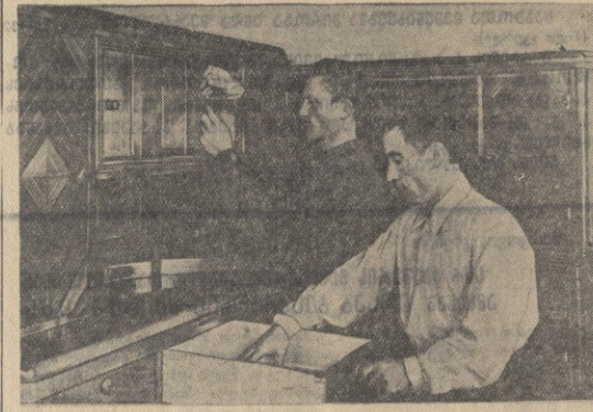
თბილისის მუსიკალური კომპლექსის ხელმძღვანელი კომპლექსის ხელმძღვანელი იმედი ნადოს მხატვრული ანუნიკი სამარტის სახელით სტანისკი რამან მხატვრული და მისი მწვეუ ბერკევიცილი კარგად აქვს მუშაობაში.

— სოქია, სოქია — ვაიხის კოლ-მურებრთა შემხალიები, აგვისტოში გა-