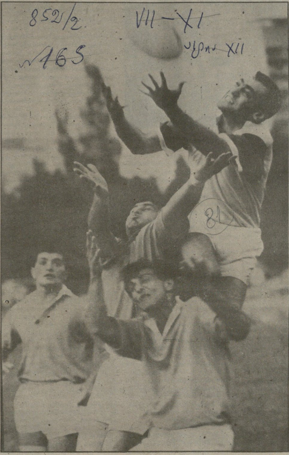
„ვესტა“ — „აია“ 18:8

ნომერი: გამაზ ანთაძე: ბილისი - თელავი - უკუბილი - თბილისი მე-6 გვერდი მხვედრა სამარალთან სმღვარგარეთ... ვიზოდ მე-8 გვერდი მცხაილარის მტამორაგოზა მე-7 გვერდი