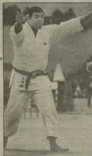
ნავთი იგავა პირველობაში, მერე ბულგარიაში გამართულ მსოფლიო ჩემპიონატში ორი ოქროს ჯილდო დაიმსხურა.

მარსელის მსოფლიო ჩემპიონატში იგავა კვლავ უმაღლეს ჯილდოს მოიპოვებდა. მაგრამ პირველ დღეს სპორტსმენს ზელი მოეცა. სპეციალისტებმა ეს ამბავი ტურნირის ყველაზე დიდ სენსაციად მიიჩნიეს: ნახევარფინალში აპონენელი მოლოდინად საბჭოთა სპორტსმენის სერგეი კოსოროტოვის ფანდებს წაოჯრი და მესამე ადგილზე დარჩა. მაგრამ ნავთიამ შექლო რანგის ადგილს აბუჯარი პირველობაში, სადაც წმინდად დამარცხა ქუთაისელი დეით ხასალეიშვილი.