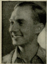
კარლ უღდენე შრაიბერი

1935 წლის იანვრის „25“ ამბობს, უწ- და იდგეს ქართული კოლტურ- რის დიდ დ ზერლინი.