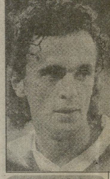
ბუნტისთავი იგორ შალიშვილი

ამერიკაში წავსვამდე ბაველ სადირინმა პრეს-კონფერენცია გამართა მოსკოვის „ჰაენა-კლუბში“ და თქვა, რომ ჯერ კიდევ იმედი აქვს, რომ მოწინააღმდეგე მხარესთან ყველაფერი მორჩილებით დამთავრდება. მან აღნიშნა, რომ ამჯერად ნაკრებში არც მოსკოვის სარატაკელები მიიწვია, ვინაიდან ისინი ჩემპიონთა ლიგის მატჩებისთვის ემზადებიან. აქვე გამოვიდა კოლოსკოვი და კიდევ ერთხელ დაამტკიცა, რომ მსოფლიოს ჩემპიონატზე ნაკრებს სადირინი უხელმძღვანელებს და ის, ვინც ამის წინააღმდეგია, ვერ ელიოსება ეროვნული გუნდის მაისურს. „ამიროვეიტებს“ კოლოსკოვი ფუფას მხრინად ხანგძლივი დამთავრდა. სადირინს კიდევ აქვს კომპრომისის იმედი. მეამბოხთა ოდღერი იგორ შალიშვილი კი კომპრომისის უკვე არარეალურად თვლის. მან ეს განუთქვა „სობესენდისკობის“ მიცემულ ინტერვიუში განაცხადა. ვფიქრობთ, ეს ინტერვიუ ჩვენს მკითხველებსაც დაინტერესებს.