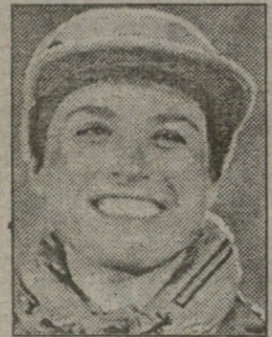
ხუთი მედლის პატრონი

19 მარტს თვიანეაში ინგლისი და უელსი „ხუთი ერის პირველობის“ გამარჯვებულს გამოავლენენ