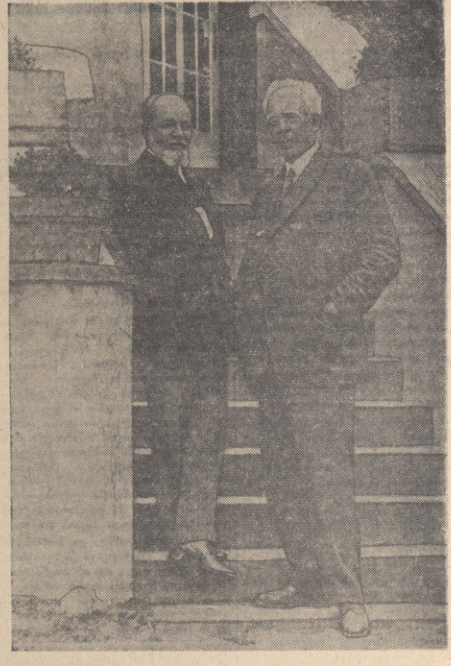
მოსკოვის სამხატვრო თეატრის დამაარსებელი კ. ს. სტანისლავსკი (1863-1938) და ა. მ. გორკი (1868-1934).

სწორედ იმ დღეებშია მიწით მოსაწყობი კარგო სტუდენტობა გაეცალა... თეატრული კულტურის მემკვიდრეების სახელობის თეატრის ათი წლის იუბილესთან...