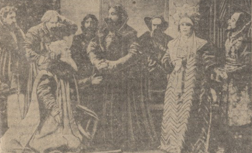
სტანისლავსკის დრამატული სემინარიის რეჟისორები...