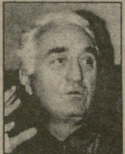
ვინაა მინც გამქონდა