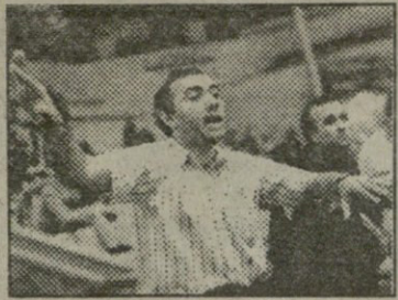
ხელბურთელთა ევროთასების წლეულს გათამაშებაში საქართველოს გუნდების ოდენობას საქმით ეთქმის — შეიძლება.

ბოლოს კი ერთ უცნაურ ამბავზე შეიძლება ისევ მოხდეს, რომ უახლოეს ზანს ერთ თბილისურ ოჯახში, ძალისხმეასთან რომ არავითარი კავშირი არა აქვს, ტელეფონმა დარეკოს და ყურმილის ამღვია ოჯახის მავანი წვერი ძალისხმეის საერთაშორისო ფედერაციამ რომელიმე დიდ — თანაც ისეთ, ზემოთ რომ ვისაუბრეთ — ტურნირზე მიიპატიჟოს. საიდან ასეთი პატივი, აკითხავთ. იქიდან, ჩემო ბატონო, რომ ჩვენი ძალისხმეის ფედერაციას უსახსრობის გამო ტელეფონით სარგებლობის გადასახადის შეტანა დაკვირვება, კავშირგაბმულობის სამინისტროს კი დიდი პრინციპულობა და შესაშური საბაზრო ეკონომიკური ოპერატიულობა გამოუჩენია და ფედერაციის ის ერთადერთი ტელეფონის ნომერი, ჩვენი ძალისხმეი გარე და შიგა სამყაროს რომ უკავშირდებოდნენ, კერძო პირისთვის გადაუცია. ამიტომაც იყო, რომ ასე გავეჭივრდა ძალისხმეის ტელეფონით დაკავშირება და მათი ღვთისნიერი მოფარაკვე მეზობლები რომ არა, კარგა ხნით ფეხით წაწვალდი მოგვიწვედა 2-3 წუთიანი სატელეფონო საუბრის ხანა ცუდოდ. ჩვენი თავი კი ჯანდაბას, რა უცხო ჩვენთვის წაწვალა, მაგრამ კავშირგაბმულობის სამინისტროში ერთი კაცი მაინც არ იყო ისეთი, კანიაშვილის ოლიმპიური ჩემპიონობა რომ გაუხარდა და, თუ გაუხარდა, ასე უცებ რამ დაავიწყა.