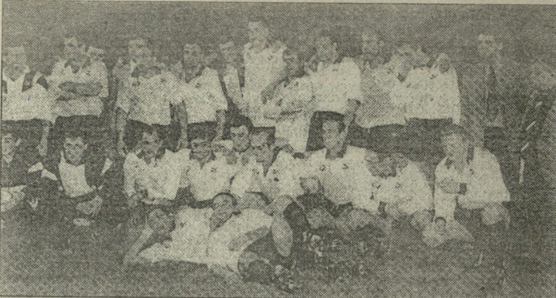
„გუმარის“ ლანგდოკელების ძლიერისა და გალანის შემდეგ