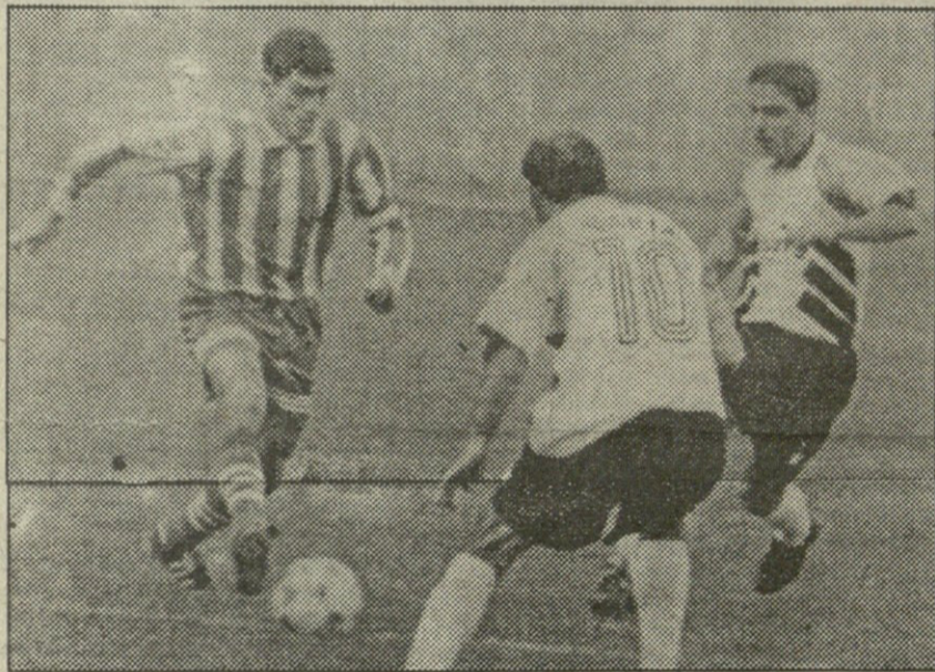
საშურის „ივერია“ ბოლო ტურში ერთობ გაუძლიანდა „დინამოს“