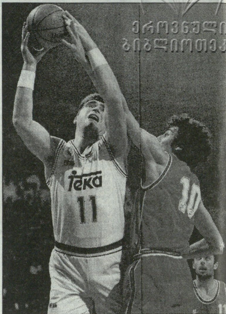
არვიდას საბონისი და პანაოტის ფასულასი

— ბრძანა ბატონმა ჯანომ. ლაპარაკია საქართველოს ეროვნულ ნაკრებზე, რომე-