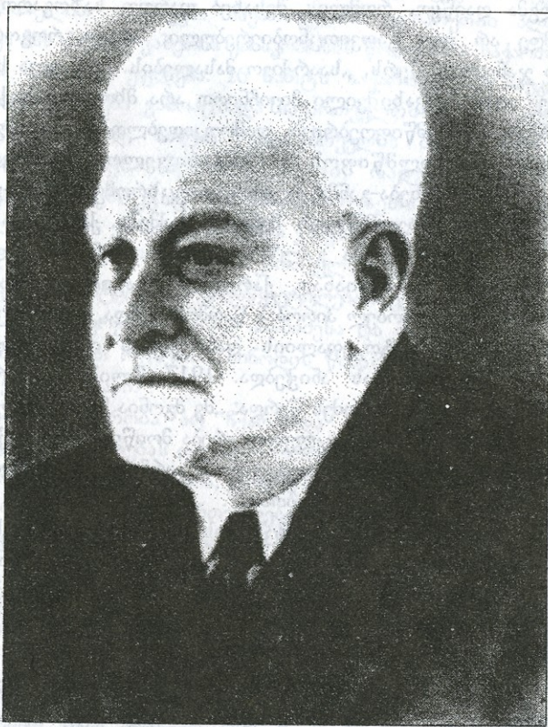
ქორნელი კეკელიძე - 1879-1962