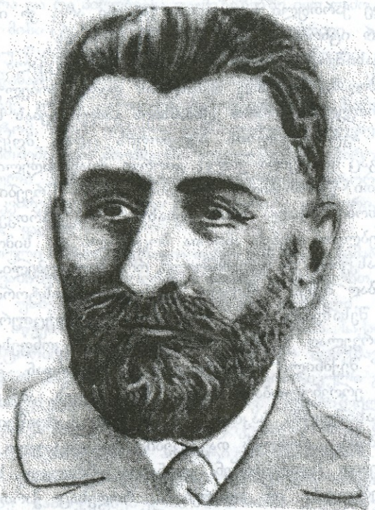
იაკობ გოგებაშვილი - 1840-1912