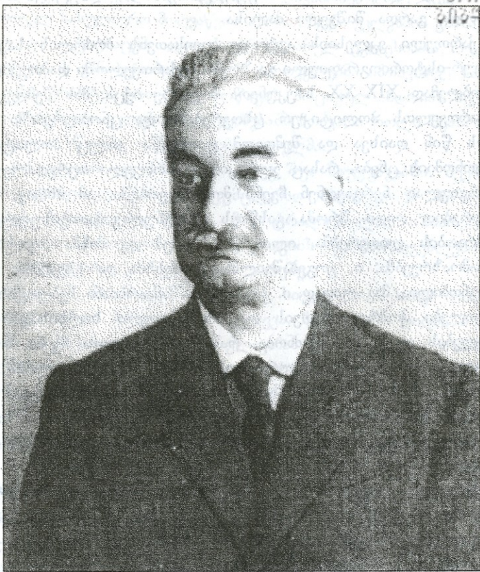
ივ. ჯავახიშვილი — 1876-1940