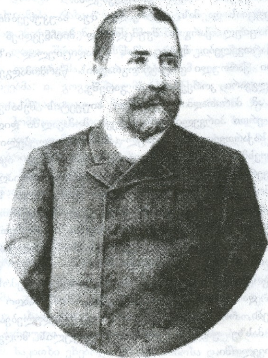
ილია ჭავჭავაძე - 1837-1907