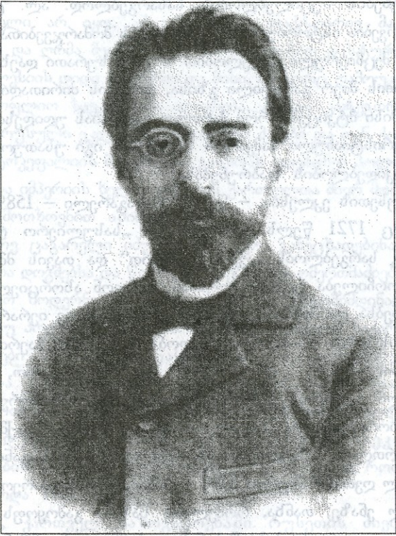
ალექსანდრე ხახანაშვილი - 1864-1911

ქართული ენის ისტორიის შესახებ მონათხრობი, თბილისი, 1911 წ. (გვ. 1-2)