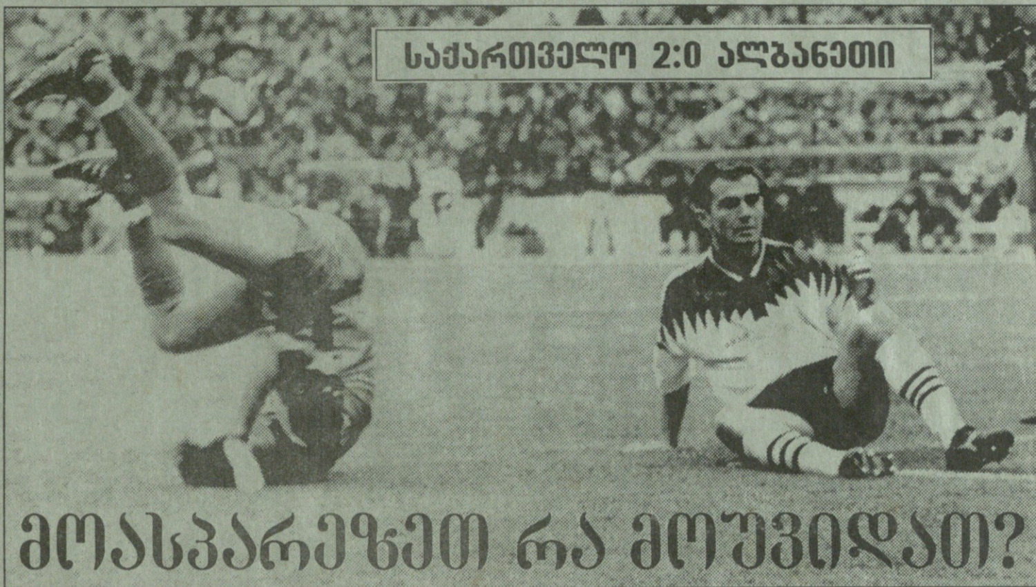
საქართველო 2:0 ალბანეთი

საქმეს ვერც მაყურებელმა უშველა. წაქეულის ცემა ქართველებს მაინცდამაინც არ გვიყვარს, ყოველ შემთხვევაში, ფეხბურთის მოედანზე. გუშინწინ კი დაბარისლობით განთქმული თბილისური „ტორსი-დაც“ აღმოფოთდა და მეორე ტაიმის შუა-