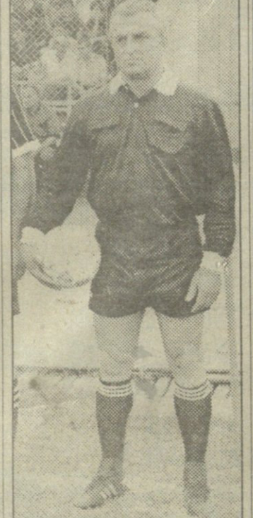
მეექვსე ჩემპიონატის 28-ე ტურში მესამე ოსტა პირველი ჯგუფის მატჩი დღემდე არბიტრმა მალხაზ კობიაშვილმა

სამტრედია — ზუგდიდი (3:0) +5(2) =3(3) -2(0) 18-9 (7-4) გიორგი დარასელია (კოლხეთი) — 26 მამუკა ხუნდაძე (ტორპედო) — 25 ალექსანდრე იაშვილი (დინამო) — 21 გელა გაბიონია (ზუგდიდი) — 20 პაატა მაჭუტაძე (ბათუმი) — 19 გია ვიშკარიანი (სამტრედია) — 17 ზვიად ენდელაძე (მარგვეთი) — 17