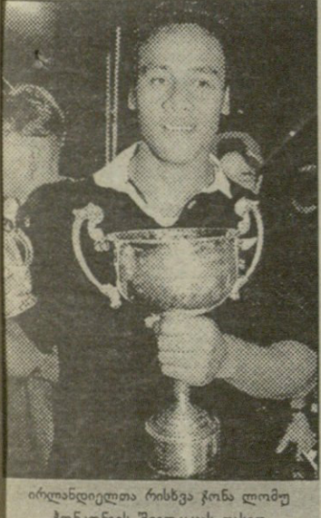
ირლანდიელთა რისხვა ჯონა ლომუ ჰონკონგის შვილკაცს თასით

წაგვეხელო ავსტრალიის სამოთხედფიზიკური მეტოქედ ინგლისი უნდა ვეგულიზმით. ბრინჯივლებმა რის ვაი-ნარობით უკლებსარგენტინელ „პუმებს“, რომლებიც ტექნიკები და მშვენიერი მობურთლები