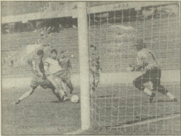
გიორგი დემეტრაძის გადამწყვეტი გოლი