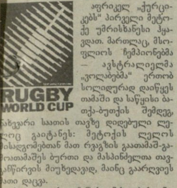
აფრიკელ „ქურციკებს“ პირველი მეტოქე უმრისხანესი ჰყავდათ. პართლატ, მსოფლიოს ჩემპიონებმა — ავსტრალიელმა „ვოლანტებმა“ ერთობ სოლიდურად დაიწყეს თამაში და სანჯისი ბათა-ბუთის შემდეგ, ნახევარი საათის თავზე დიდებული ლელოც გაიტანეს: მეტოქის ლელოც მისდგომბთან მათ რაგბის გაათამაშ-გართობაშეს ბურთი და მასპინძელთა თავგანწირვის მთხედვად, მინც გარდღივს მათი დავა.

სტოპობათს დიდი ხნის ნაბიჯი მომენტის დადასტურება: სამხრეთი აფრიკის პრეზიდენტმა ნელსონ მანდელამ რაგბის მსოფლიო თასის მე-5-ე გათამაშება რომ გახსნა, თავისი განახლებული ქვეყანა ციხარტყელად მოიხსენია, მსოფლიო რაგბის განმავითლებს კი გულწრფელი მადლობა მოახსენა ეგზომ დაფასებისათვის, აქაო და ქვეყნიერების სარაგბო ნაღების მასპინძლობა ჩვენთვის უდიდესი პატივია.