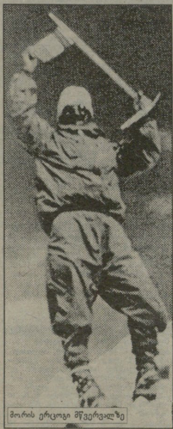
მორის ერცოვი მწვერვალზე