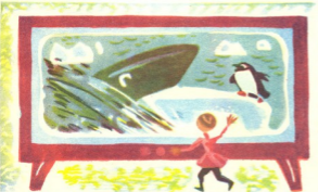
— აბა, ლურჯა, ვუშველოთ! ჯერ გლობუსზე მოვძებნოთ პინგვინეთი!

ბინდდებოდა, სად უნდა მეძებნა?! ჩემს ბიძაშვილს შევეცოდე და გამოძევა. ბევ-