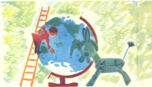
— ჩქარა არქტიკისაკენ!