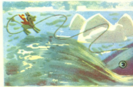
ყინული, რომელზედაც პინგვინი ზის, ზვიგენს ყელში გაეჩხრა!