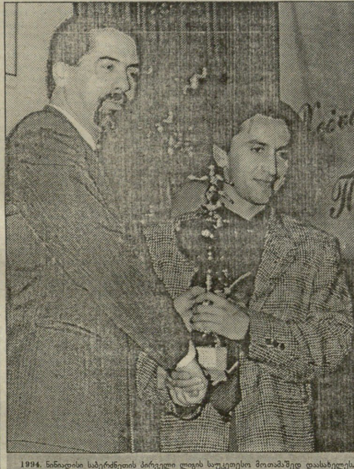
1994. ნინიადისი საბერძნეთის პირველი ლიგის საუკეთესო მოთამაშედ დაასახელეს. ანდრო სწორედ ამის შემდეგ მოხვდა უმაღლეს დივიზიონში