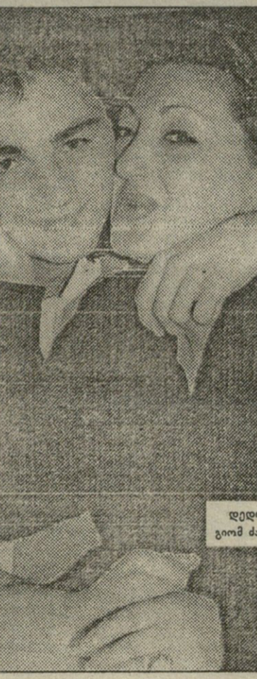
დედის ჩასვლით გიომ ძალიან გაიხარა

ნიგოზი და ცხარე სუბულები ჩამოიტანა, მან თავი კარგად იგრძენა. აქ, შესაძლოა, ამინდი ისეთი თბილი ვერაა, როგორც შავი ზღვის პირას, მაგრამ ცხოვრების დონის ხალხს და ცვა ქარს აძლევს.