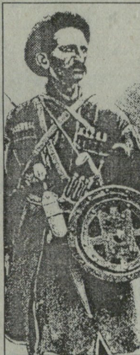
შეიარაღებული ხევსურის ეს ფოტო ერთ-ერთია 1910 წელს ქართულ საბრძოლო ხელოვნებაზე პეტერბურგში გამოცემული რუსული წიგნიდან