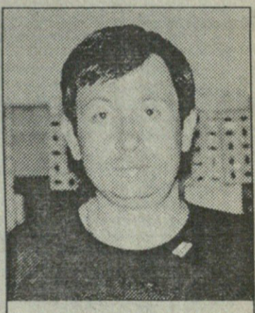
სამართავლოს დროშა და ენისელის რიკლამა ამერიკის კანფეროზა

სხვა მატჩები: ბათუმი — გური (სომხეთი) 0:0, ბათუმი — მარგვეთი 1:1, მარგვეთი — ზუგდიდი 1:1. ამჟამა კვანტალიანი