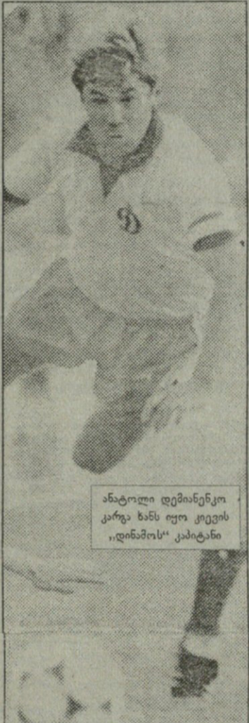
ანატოლი დემიანენკო კარგა ხანს იყო კიევის „დინამოს“ კაპიტანი