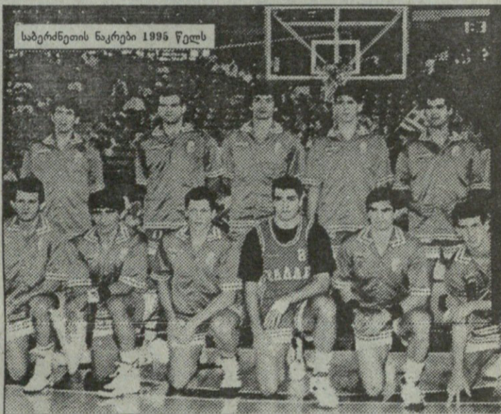
საბერძნეთის ნაკრები 1995 წელს

ეს ამერიკაში დაბადებულ-გაზრდილი ბერძენი კალათბურთის იჭურ კოლეჯ-უნივერსიტეტებში ეხიარა. 1979 წლის დრაფტში იგი „ბოსტონ სელტიქსმა“ ამირჩია, მაგრამ გალისმა უარი თქვა. მისი თამაშზე და ისტორიულ სამშობლოში დაუბრუნდა. სწორედ აქედან იწყება ბერძნული კალათბურთის რენესანსი. ნიკოსის დიდოსტატობამ იმდენად მოხიბლა ბერძენი ბიზნესმენები და იჭური ფირმები, რომ