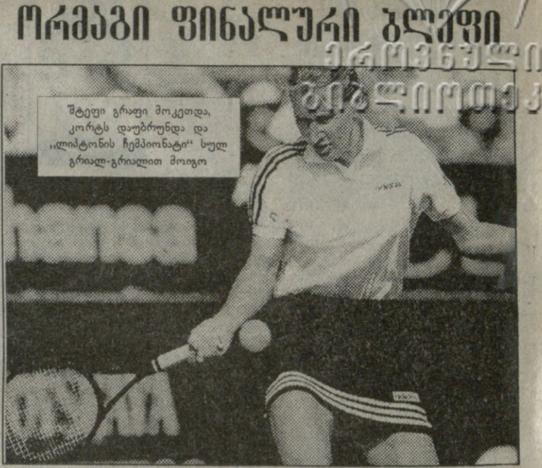
შტეფი გრაფი მოკეთდა, კორტის დაუბრუნდა და „ლიბტონის ჩემპიონატი“ სულ გრძალ-გრძალით მოიგო

რა კარგად დაწვილებული შეჯიბრი ეს რა უღიმღამოდ დასრულდაო - დაიჩვილებდნენ მთელი მსოფლიოს ჩოგბურთის მოყვარულები, შაბათ-კვირის სიხანდა ფინალის რომ ნახავდნენ. აი, მანამდე კი ბარაქიანი ჩოგბურთი უხვად იყო კი-ბისკინის (ფლორიდა, აშშ) „ლიბტონის ჩემპიონატზე“. სუპერ-8-ში, 28 მარტი ქალთა ნახევარფინალისა და ვაჟთა ბოლო ორ მეთრეფიანდის დათმობა. შტეფი გრაფს (1) ამქვრად ვეღარ გაუძლიანდა ნორჩი ლინდზი დავერბონტი (აშშ), ათი დღით ადრე გერმანელს ინდიან-ველზში ორი საათი და 47 წუთით მოუგო. გრაფმა 66 წუთში გაიმარჯვა 6:4, 6:4, რის შემდეგაც ჩანდა რუბინმა (აშშ, 7) 4:6, 6:4, 6:2 აჯობა მსოფლიოს 91-ე ჩოგანს, განუთესელ კარნა მამსულდოვას (სლოვაკეთი). ვაჟთა მატჩებში მრავლად იყო ეისი. გორან ივანიშვიტმა (ხორვატია) 12 გაახერხა და ისე დათრეფა დისკომპონირებული მაიკლ ჩანგი (აშშ), რომ ბევრი შეცდომა დააშვებინა. გორანს არ ჩამორჩა პიტ სამპრასი (აშშ), განუთესელი თანამემამულე ვინს ლეინას რომ ეთამაშებოდა. ხორვატმა 6:4, 6:4 გაიმარჯვა, ამერიკელმა - 6:3, 6:4.