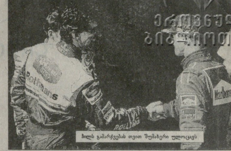
პილი გამარჯვებას თვით შუმბერი ულოცავს

არადა, ბრუნოს, ვინაც ხსენებულ შერკინებამდე ჩემპიონი იყო, ზონორარი ხუთჯერ ნაჯიბი იყო.