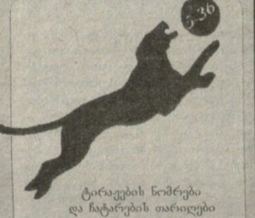
ტირაჟების ნომრები და ჩატარების თარიღები